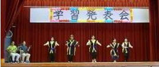
幕開け(かぎやで風)職員、地域の方、飛び入り