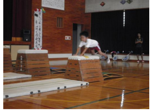
跳び箱(めざせ東京オリンピック)