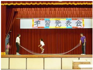
縄跳び50回跳べたゾ