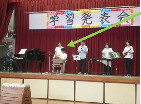
先生方と合奏(ハギヤムン)