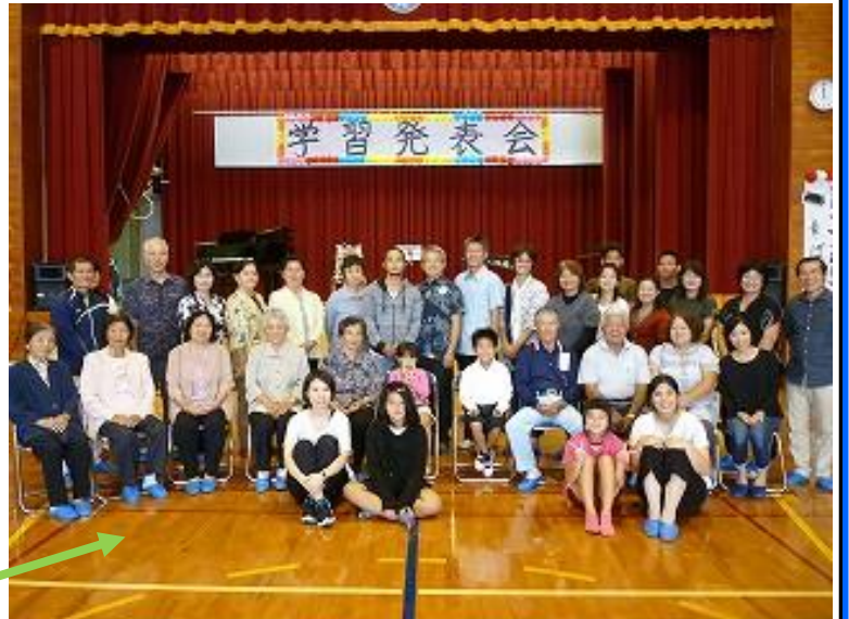
斉磨君を囲んで記念写真 学習発表会を参観した方々