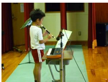
ソプラノリコーダー