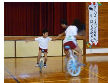
卒業生、友達と一輪車