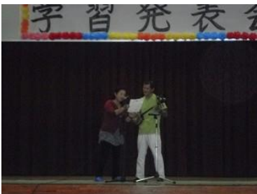
三線と歌(飛び入り)