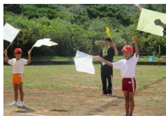
校歌ダンス(児童・学生)