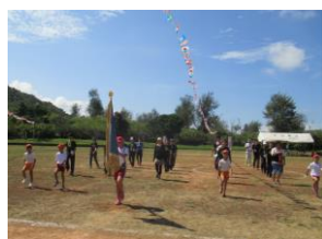
児童・保護者・地域・大学生入場

ホウオウボク(鳳凰木)が咲き、こがね森が輝く緑の中、本校運動会への御声援を下さり誠に有り難うございました。学習の成果を精いっぱい発揮し、子ども達一人ひとりが達成感と満足感を得る運動会への激励、本当に有り難うございました。個々が諦めず一輪車をがんばる姿、5人が仲良くエイサーを楽しむ姿が、成果としてご披露できたと思います。これも、地域の方々、郷友会や地域大学生(沖縄大学15名・名桜大学3名)の御声援、御協力により達成できたものです。職員一同心より感謝申し上げます。