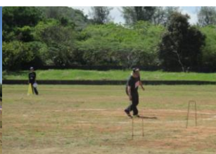
ゲートボールリレー